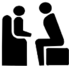
圖四 兒童安全座椅