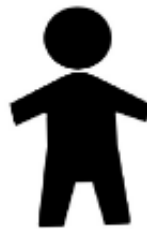
圖五 兒童馬桶或兒童小便器