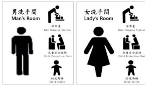
圖二 設備種類標誌