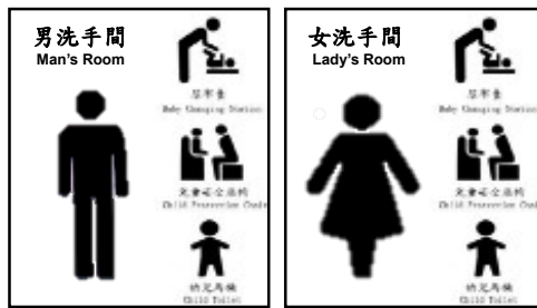
圖二 設備種類標誌