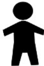
圖五 兒童馬桶或小便器