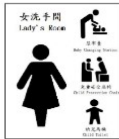
圖二 設備種類標誌